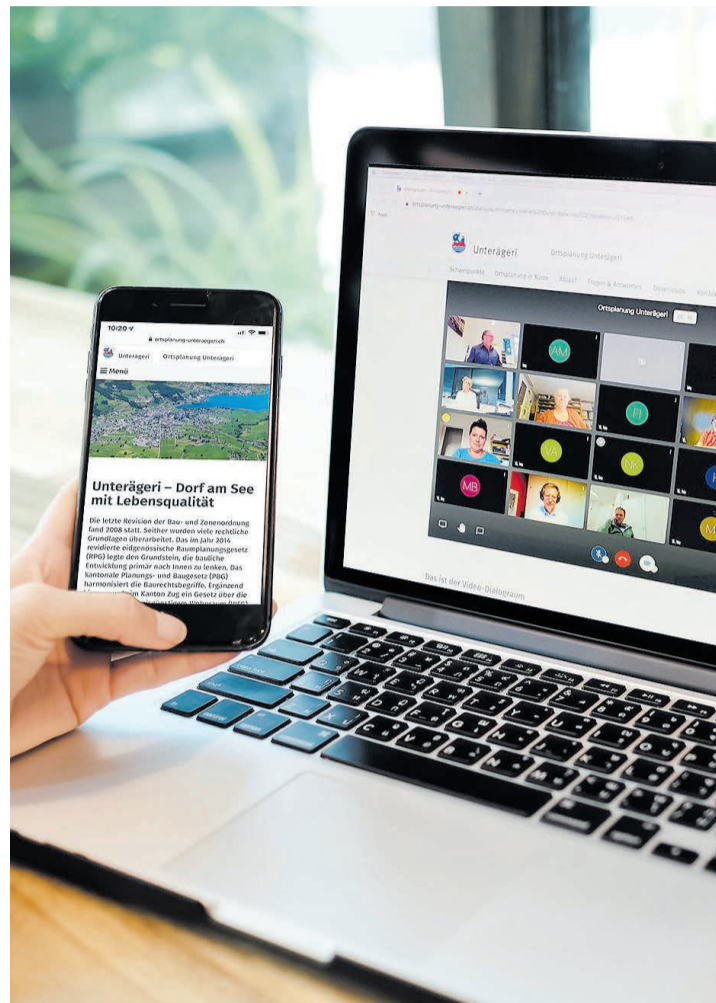
Austausch im Video-Dialograum mit den politischen Parteien.