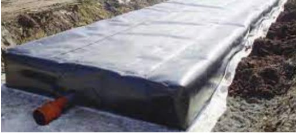
Abbildung 4: Rausikko Boxen – Unterirdische Retentionsanlagen

Nachfolgend sind einige mögliche Beispiele von Retentionen aufgezeigt.