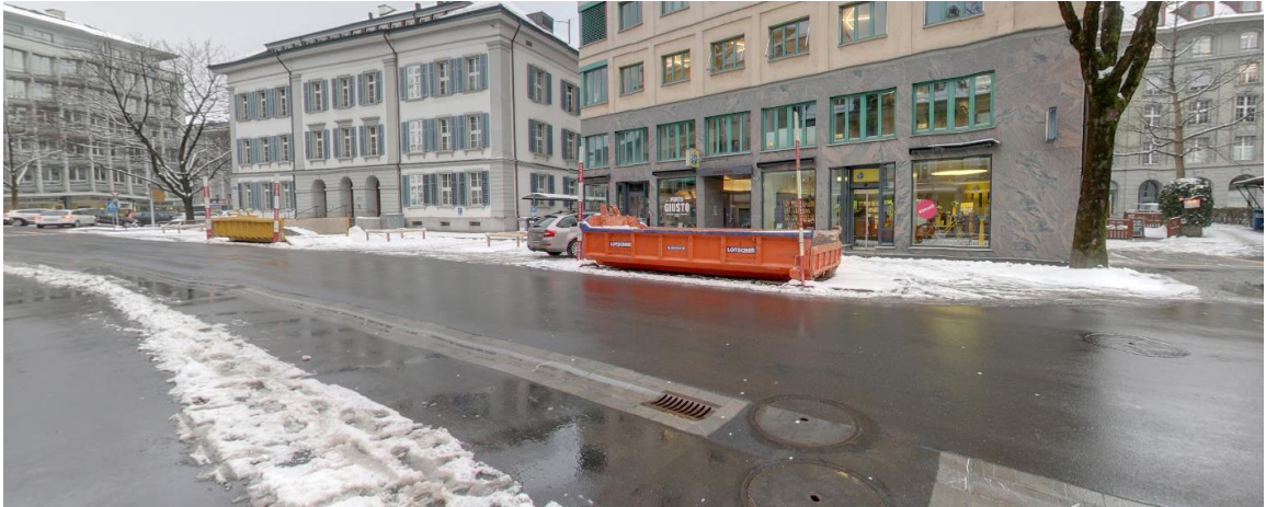
Abbildung 9: mögliche Strassenentwässerung mit einer offenen Rinne und Schlammsammler