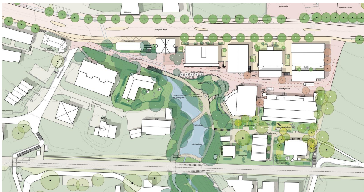
Abbildung 1: Übersicht Überbauung Mühleweiher

Für die weitere Planung soll mit dem vorliegenden Fachgutachten die Retention bereits im Bebauungsplan berücksichtigt werden.