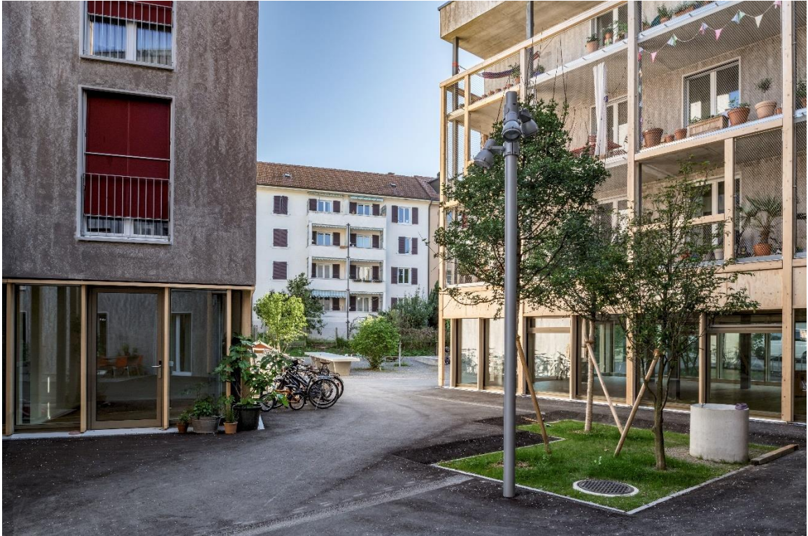
Abbildung 11: mögliche Strassenentwässerung einer offenen Belagsrigole mit Entwässerung in Baumgruben