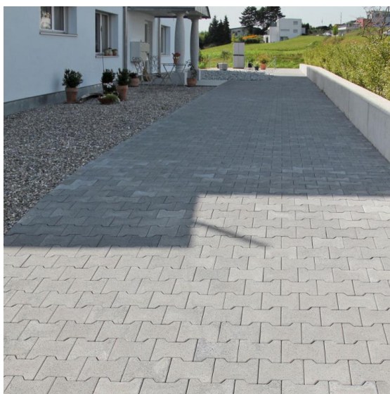
Abbildung 8: Versickerbare Verbundsteine