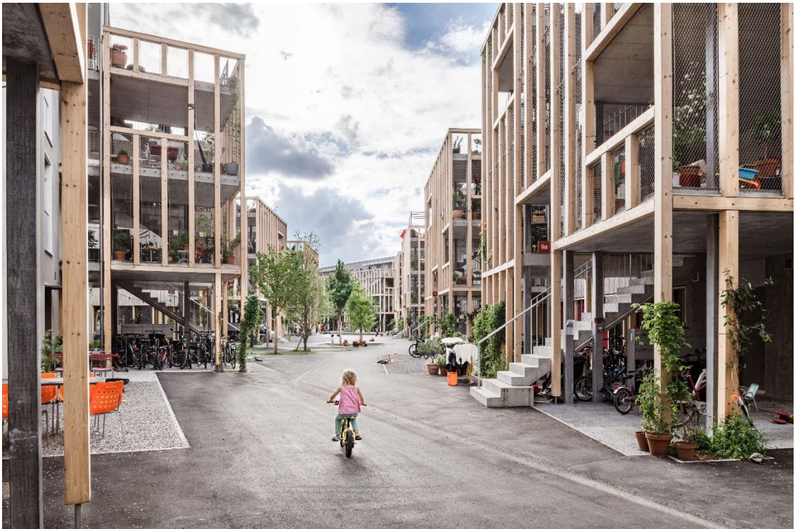
Abbildung 10: mögliche Strassenentwässerung einer offenen Belagsrigole mit Entwässerung in Baumgruben