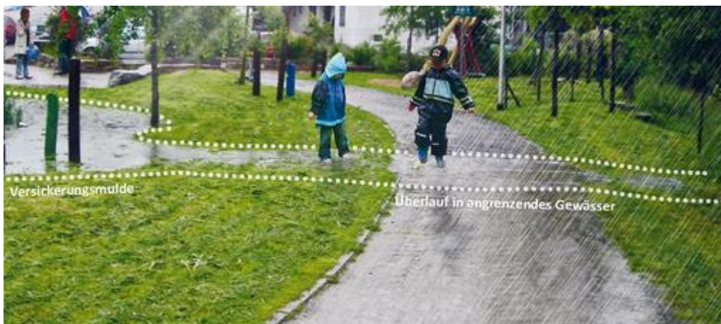
Abbildung 7: Versickerungsmulden mit Überlauf in angrenzendes Gewässer