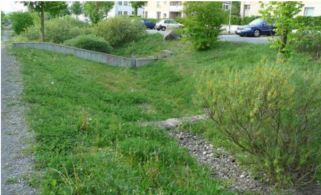
Abbildung 5: Mulden und Rigolen als mögliche Retention und Versickerungen