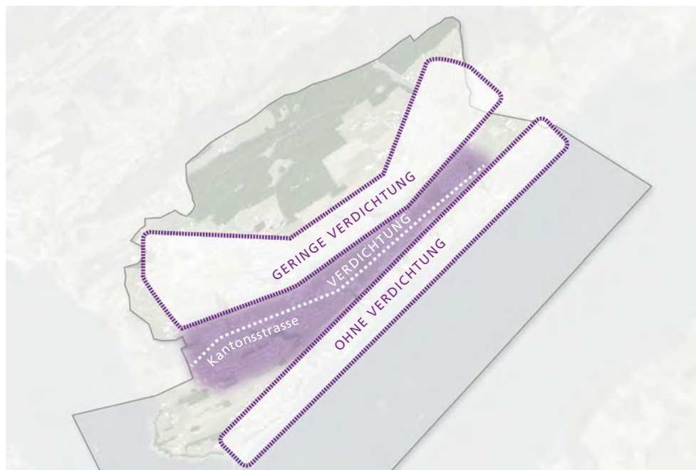
Potenziale zur Innenentwicklung für die einzelnen Quartiere von Meggen.

Basierend auf statistischen Daten wie Einwohner- und Wohnungsdichte, Wohnungsbelegung, Wohnflächen der kantonalen Dienststelle Raum und Wirtschaft (rawi) wurden die quantitativen Potenziale zur Innenentwicklung für die einzelnen Quartiere von Meggen ermittelt (Quartieranalyse, siehe nachfolgende Grafik).