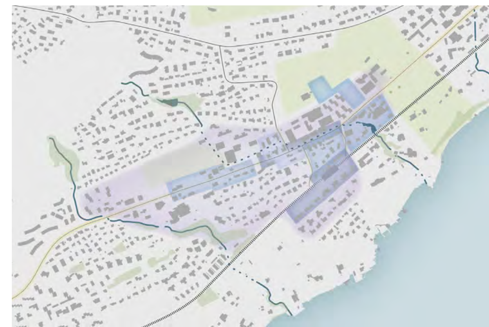
Masterplan Meggen Zentrum gemäss dem gleichnamigen Flyer.